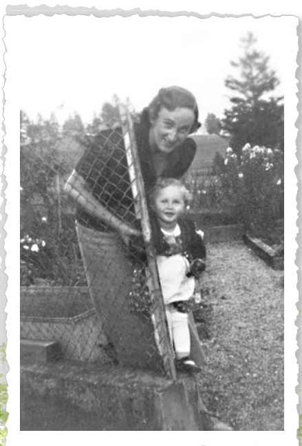
Gabi mit ihrer Mütti