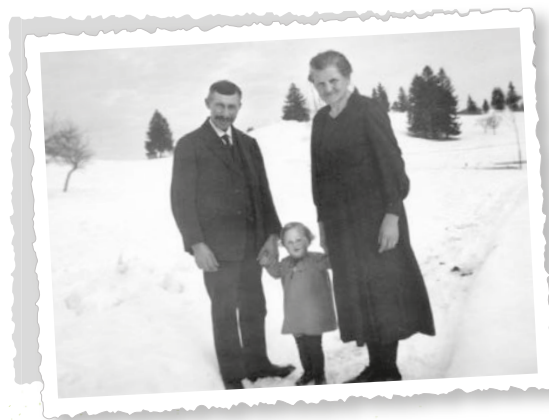
Gabi mit Mama und Papa