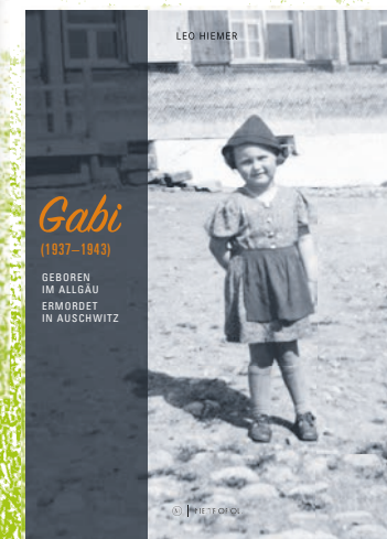
Cover des Buches von Leo Hiemer