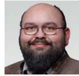
Markus Striedl AfD