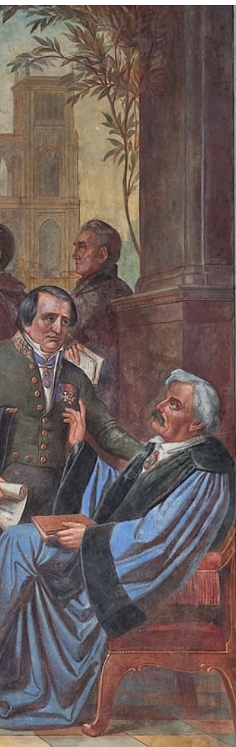
Fresko im Konferenzzimmer: Die imaginäre Einführung Alexander von Humboldts in einen Kreis berühmter Männer aus Kunst und Wissenschaft, von Engelbert Seibertz v.l.n.r.:

Jedenfalls hat Maximilian II. seiner Ordensidee mit dem Fresko ein bleibendes Denkmal gesetzt (Der Freistaat hat übrigens den Maximiliansorden 1980 wieder begründet), während der Künstler Engelbert Seibertz heute so gut wie unbekannt ist. Der Historienmaler, zu Lebzeiten hochgeehrt, wurde 1813 in Brilon im Hochsauerland geboren. Nach dem Abitur in Arnberg studierte er an der Kunstakademie in Düsseldorf vor allem Porträtmalerei. In München setzte Seibertz dann seine Studien fort und nahm 1850 seinen ständigen Wohnsitz in der Haupt- und Residenzstadt. Der Westfale zählte zum Künstlerkreis um König Maximilian II. Deshalb bekam er den Auftrag, an der künstlerischen Ausgestaltung des Maximilianeums mitzuwirken. Auch der Sgraffito-Zyklus im Treppenhaus stammt von Seibertz. Der Künstler starb 1905 im Alter von 92 Jahren in Arnberg.