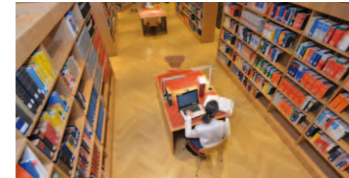
Archivbenutzung im Lesesaal der Landtagsbibliothek

Bei Fragen zum Landtagsarchiv wenden Sie sich bitte an die Zentrale Informationsstelle im Bibliothekslesesaal. Das Formular für Benutzungsanträge finden Sie auch im Internet unter www.bayern.landtag.de > Dokumente > Landtagsarchiv