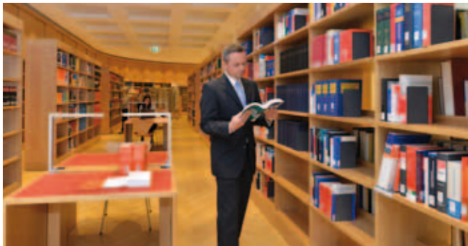
Freihandbestand im Lesesaal der Landtagsbibliothek

Die Bibliothek umfasst rund 60.000 Bände und hält ca. 250 laufende Zeitschriften vor. Sie stellt in ihrem Lesesaal die wichtigsten deutschsprachigen Tageszeitungen und nahezu alle bayerischen Regionalzeitungen zur Verfügung. Der Bibliotheksbestand ist im Intranet des Bayerischen Landtags online recherchierbar und bestellbar.