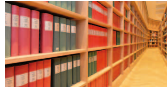
Die Beratungen und Beschlüsse des Bayerischen Landtags werden sowohl in Papierform als auch elektronisch veröffentlicht.

Mit dem Abonnement-Service können Sie Tagesordnungen, Drucksachen und Plenarprotokolle per E-Mail abonnieren. Sie können auswählen, für welche Dokumente Sie sich interessieren und erhalten dann automatisch eine E-Mail sobald neue Dokumente zu den von Ihnen ausgewählten Themen oder Vorgangsarten veröffentlicht wurden. Neben einer Kurzbeschreibung enthalten die E-Mails direkte Links zu den jeweiligen Dokumenten.