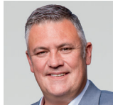
Roland Magerl AfD