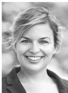
Schulze, Katharina Bündnis 90/Die Grünen

Dipl.-Sozialpädagogin (FH), Systemische Therapeutin DGSF; 82008 Unterhaching - *1971; Stimmkreis München-Land-Süd