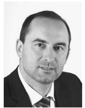
Aiwanger, Hubert FREIE WÄHLER

Staatl. gepr. Elektrotechnikerin, Bundesministerin; 83620 Feldkirchen-Westerham - *1964; Stimmkreis Miesbach