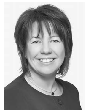
Stachowitz, Diana SPD

Staatsminister; 80805 München - *1961; Stimmkreis München-Schwabing