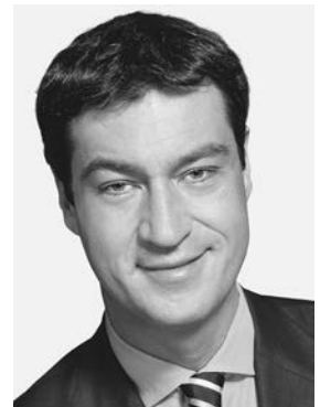
Söder, Dr. Markus CSU

Staatssekretär; 94447 Plattling - *1971; Stimmkreis Deggendorf