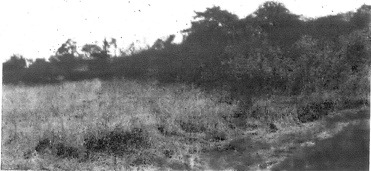
Bild 2, Beispiel einer vergleichbaren Fläche nach Aussetzen der Pflege für 2 Jahre